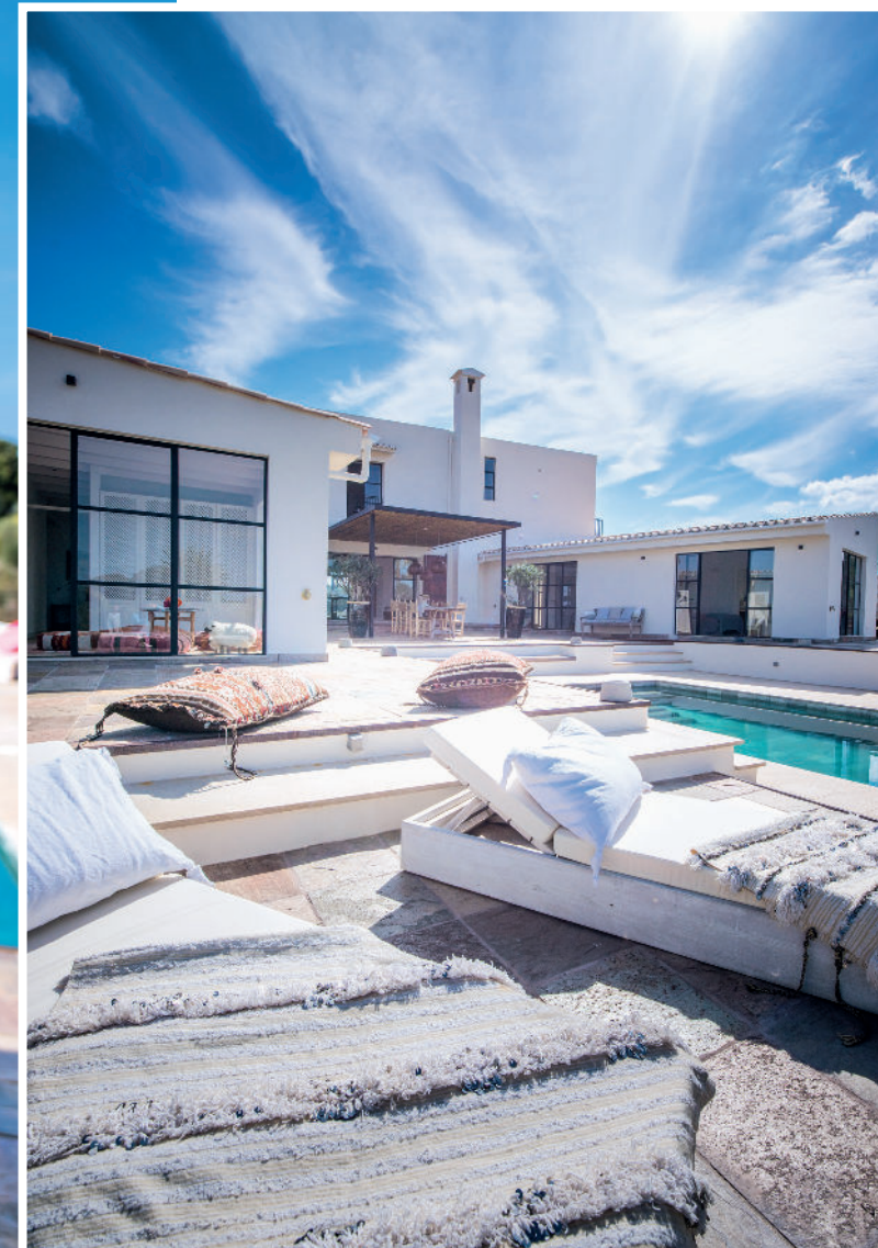
Dominasi seleksi warna palet terang memberikan kesan clean dan bright dalam hunian bohemian yang modern ini.