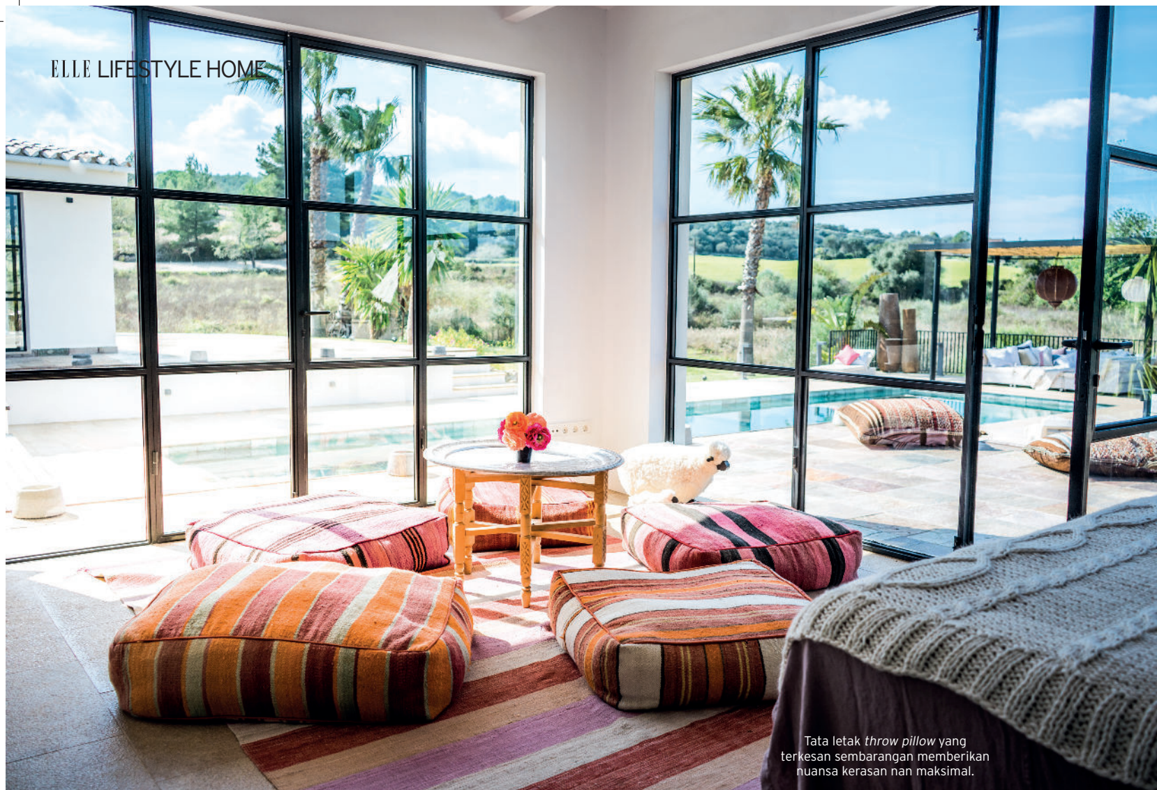
Tata letak throw pillow yang terkesan sembarangan memberikan nuansa kerasan nan maksimal.

Ada jutaan ide brilian di bumi ini, tapi hanya beberapa yang mau mewujudkannya menjadi nyata. Dan saya adalah salah satu yang langsung beraksi saat saya meyakini ide yang dimiliki,” tutur Christine Leja mendeskripsikan spirit dan filosofinya dalam membangun sebuah proyek. Hal ini pula yang ia terapkan setelah mengambil alih sebuah lahan yang terabaikan di dekat kota Palma, pulau Mallorca, untuk disulap menjadi living space bergaya modern tanpa meninggalkan vibrasi keotentikan country dwelling khas Mediterania. Dengan neighborhood rural Porreres, rumah Can Raco ini