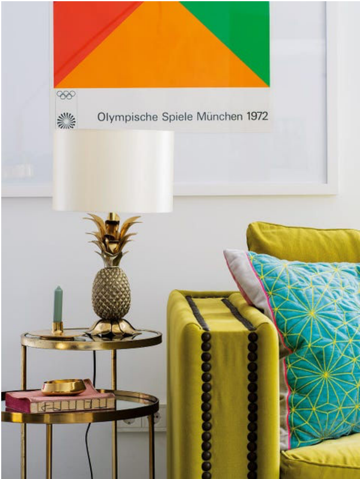
Mesitas auxiliares en dorado y lámpara con pie de piña de Bconnected. Mauricio Fuertes