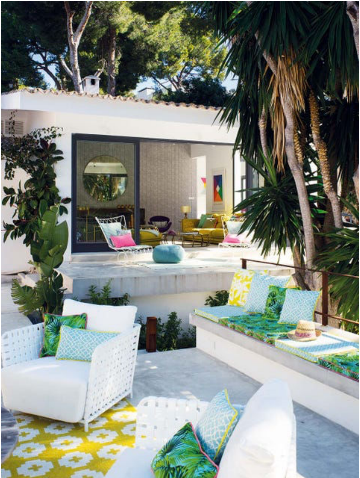
Delante del salón se situó una zona de estar al aire libre con butacas metálicas de Gervasoni y alfombra de Brita Sweden. Mauricio Fuertes